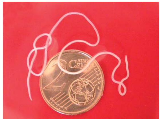
Adultwurm oder Makrofilarie von Dirofilaria repens (14,4 cm Länge)