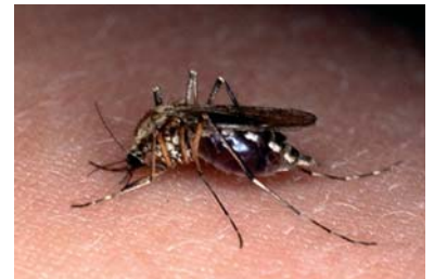
Stechmücken sind die Überträger von Dirofilaria immitis und D. repens

D. repens ist humanpathogen, mit mehr als 270 in Europa beschriebenen Fällen. In Europa ist dieser Parasit im ganzen Mittelmeerraum, Portugal, auf den Kanaren und im Balkan (häufig in Ungarn) und in der Ukraine verbreitet.